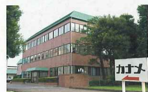
(株)カナメ/ルーフシステム(株)

本社 栃木県宇都宮市 平出工業団地38-52 設立 1971年10月 資本金 4800万円 従業員 244人(関連会社含む) 事業内容 住宅屋根・外壁リフォーム、 大型施設の屋根工事、 施設の屋根リニューアル、 社寺建築・改修工事 電話番号 028-660-3831 http://www.caname.net