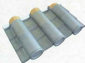
チタン瓦のサンプル