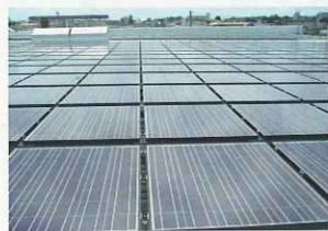
(株)カナメでは、太陽光発電などの環境分野にも力をいれている。